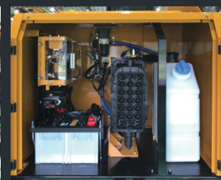
尿素タンク、エアクリーナ類