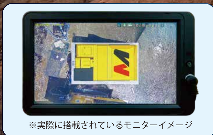
※実際に搭載されているモニターイメージ