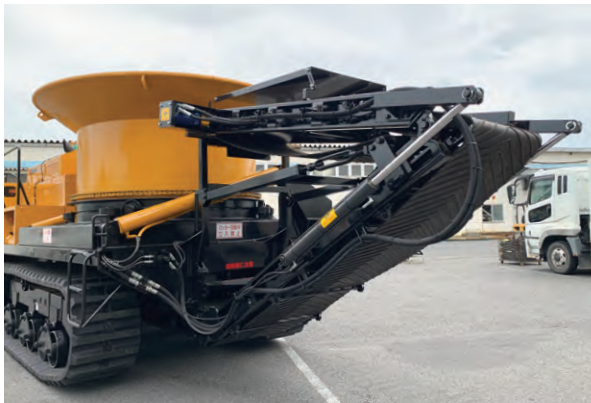
折畳式ベルトコンベア

従来の高性能な破碎能力はそのままに 排出コンベアの数アップにより排出効率と処理量が増加