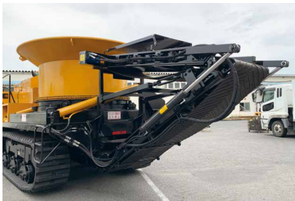
折畳式ベルトコンベア

従来の高性能な破砕能力はそのままに 排出コンベアの数アップにより排出効率と処理量が増加